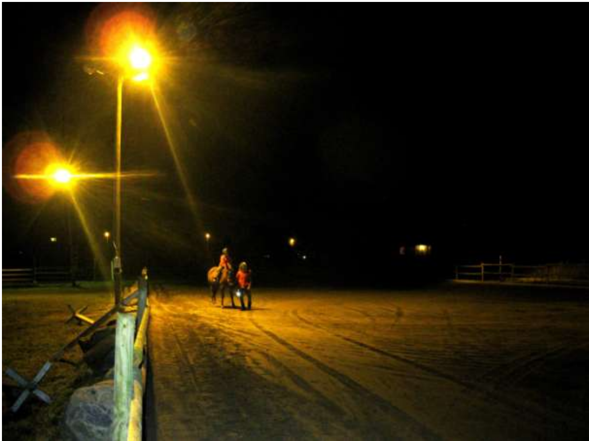
Pimedas on eriti hästi näha lõpptöö kvaliteet.