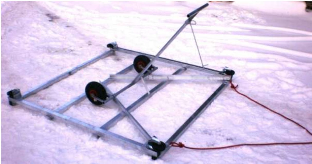
Liivaplatsi silur tööasendis.